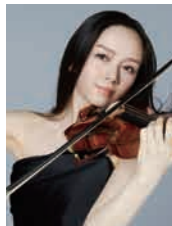
【20日 特別ゲスト】 宮本笑里(ヴァイオリン)