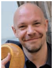
ニコラ・テュリエ [フランス] (ハープ)