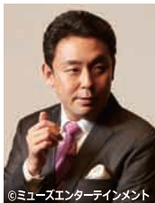
【19日 特別ゲスト】 横山幸雄(ピアノ)