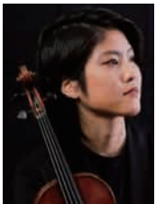
藤原晶世 (ヴァイオリン)